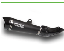
Arrow Endschalldämpfer schwarz