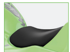
Hoherer Sitz +20 mm (Ninja 125)

Aktuelle Infos über die Modelle, Accessoires und unsere Händler findest du auf www.kawasaki.ch